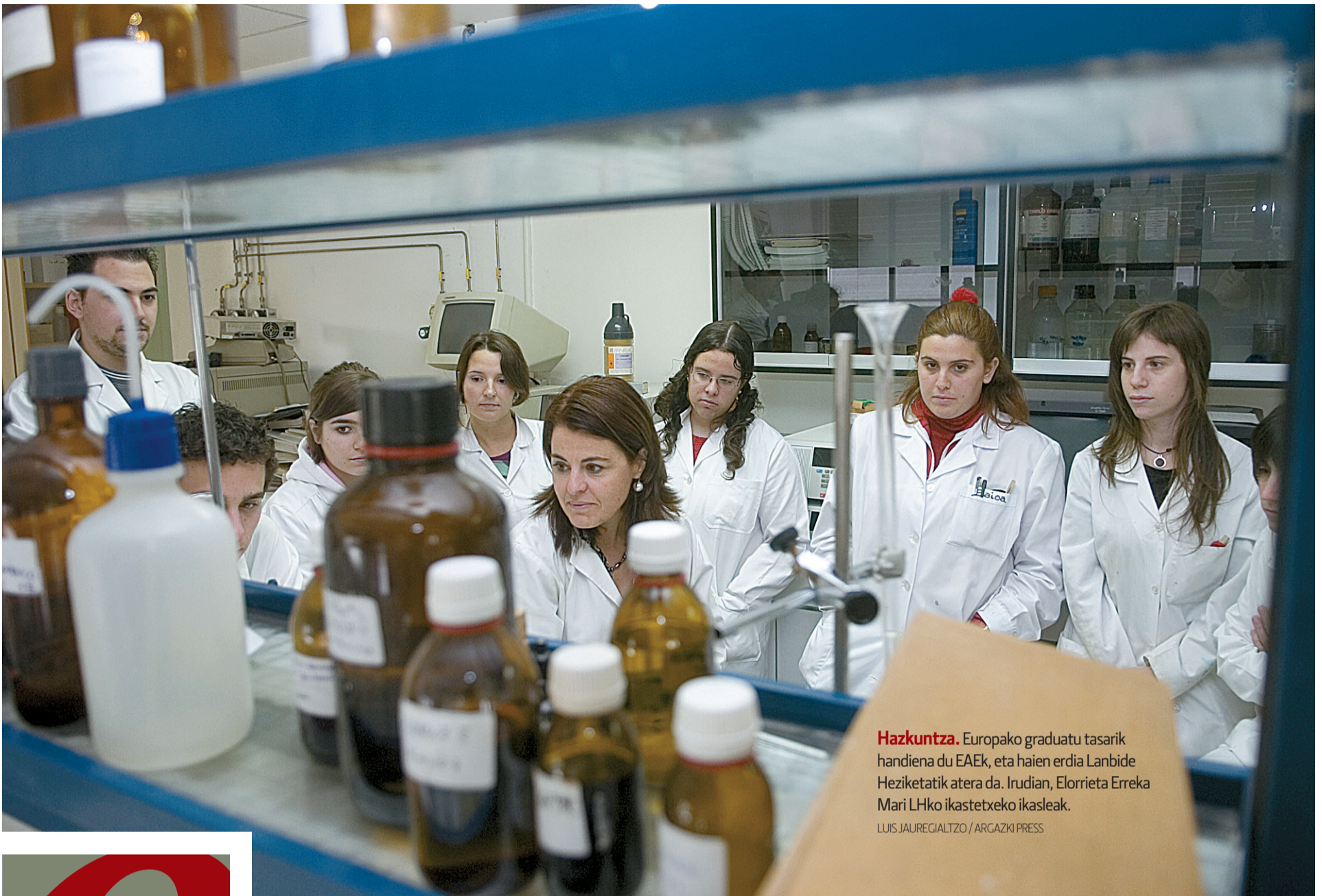
Hazkuntza. Europako graduatu tasarik handiena du EAEk, eta haien erdia Lanbide Heziketatik atera da. Irudian, Elorrieta Erreka Mari LHko ikastetxeko ikasleak.