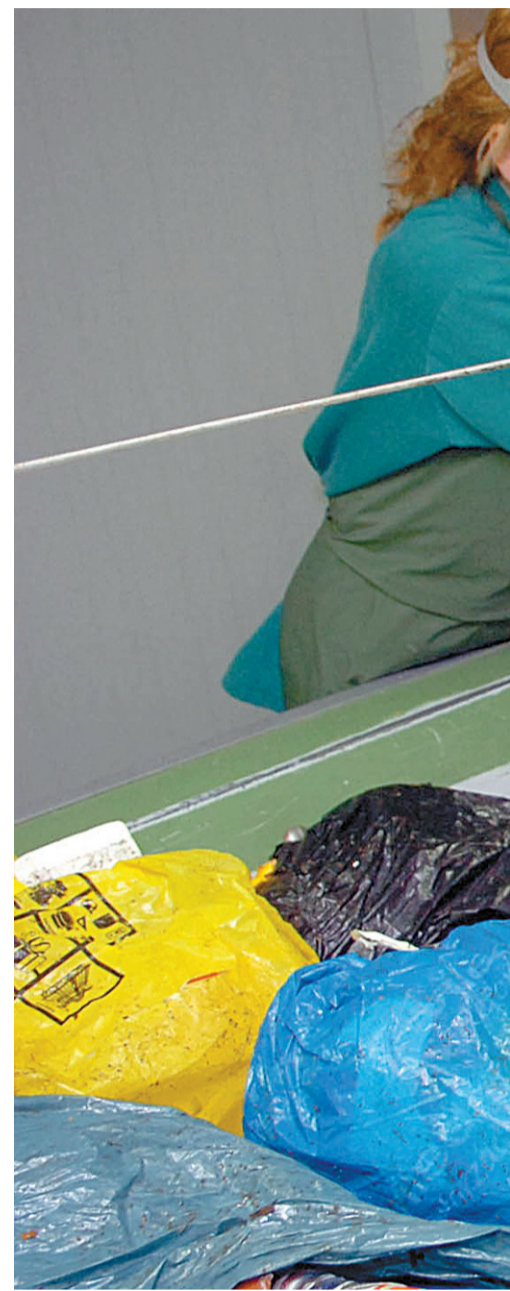
Tuterako (Nafarroa) El Culebreteko zabortegetira eramaten

Bizkaian 628.292 bat tona hiri hondakin sortzen dira urtean, 2005eko datuei erreparatuta; 552.797 kilogramo biztanleko. Hala, Bizkaia da zabor gehien sortzen duen herrialdea oro har, baina baita biztanleko ere. Zabor horren kopururik handiena zabortegetara doa, baina beste zati bat (iaz %32 inguru) Zabalgabiko errauste plantan erretzen da. Kopuru hori bikoiztu eta %65eraino iristeko asmoa dute Bizkaiko agintariak, beste errauste planta bat egiteko xedearen alde egin baitute. Horretarako, Bilboko zaborrak jaso nahi dituzte errauste plantan. Baina oraingoz, ordea, Artigasko zabortegeta eramaten